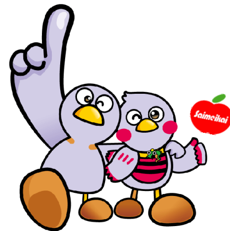
埼玉県マスコット『コバトン』『さいたまっちゃん』